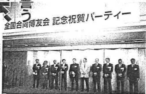
全国合同博友会会長、幹事長が一堂に会した

役社長)が開会を宣言し、博友会幹事長の中原悦夫氏がまず登壇、全国から集まった博友会関係者に謝辞を述べた。続いて来賓に招かれた安倍晋三官房長官がスピーチ、下村議員へ次のようなエールを贈った。