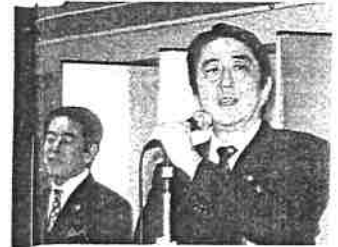
下村議員にエールを送る安部晋三官房長官