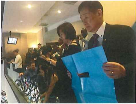
ラウンジからの応援と撮影