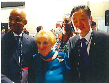
オルブライト元国務長官=中央