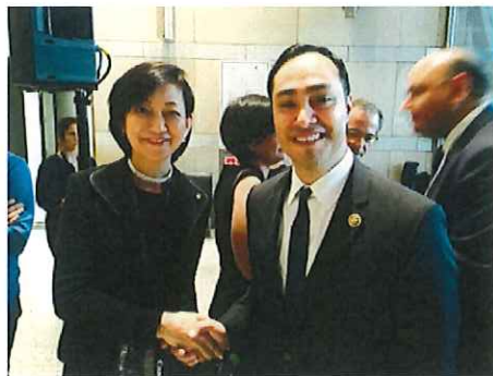
カストロ下院議員と