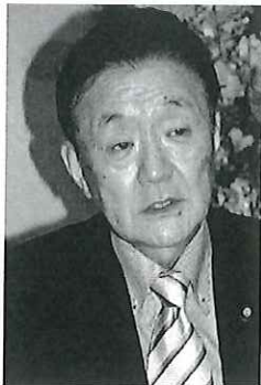
藤田幸久参議院議員