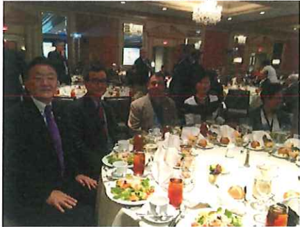
チャンドリー列国議会同盟 (IPU) 議長・サム・レンシー党党首夫妻 (カンボジア)