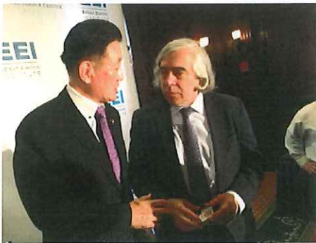
モリッツ・エネルギー省長官と