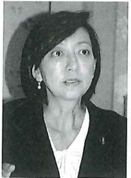
牧山ひろえ参議院議員