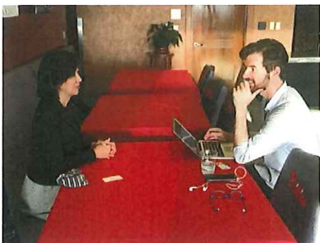
NYタイムズインタビュー