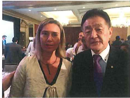
モゲリーニEU外交安全保障上級代表と