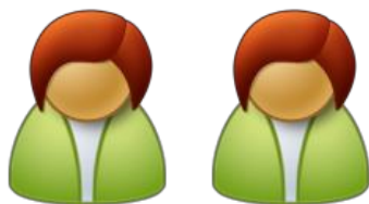
夫人付職員(経産・常駐)