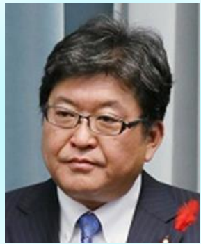
客員教授 内閣官房副長官 萩生田光一氏