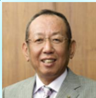
加計孝太郎 理事長