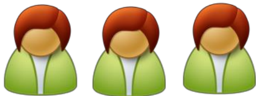
夫人付職員(外務・非常駐)