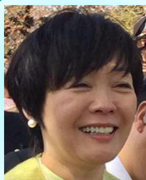
安倍昭恵首相夫人