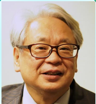
元内閣官房参与 木曾功学長